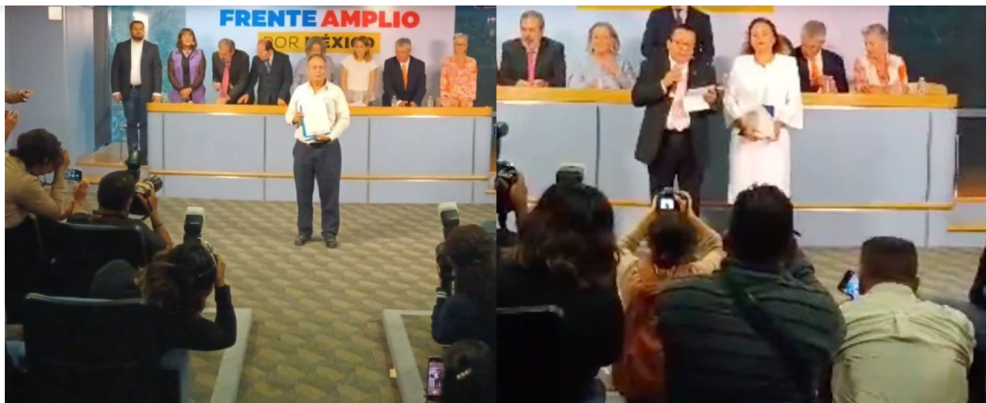
Dos perfiles ciudadanos se suman a contienda de oposición por candidatura presidencial